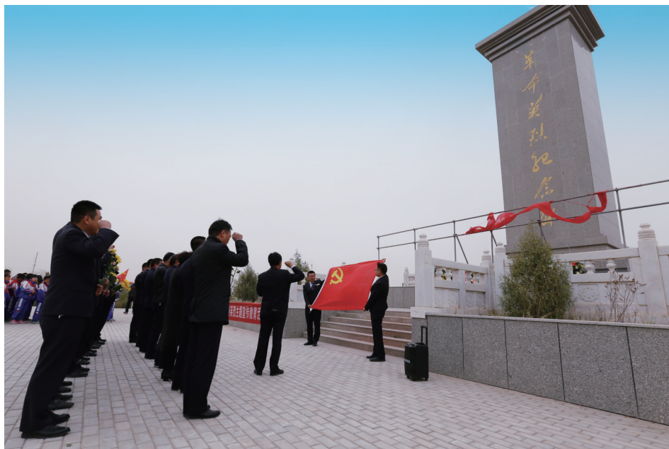
民乐农商银行开展“铭记·2018清明祭英烈”主题宣传教育活动