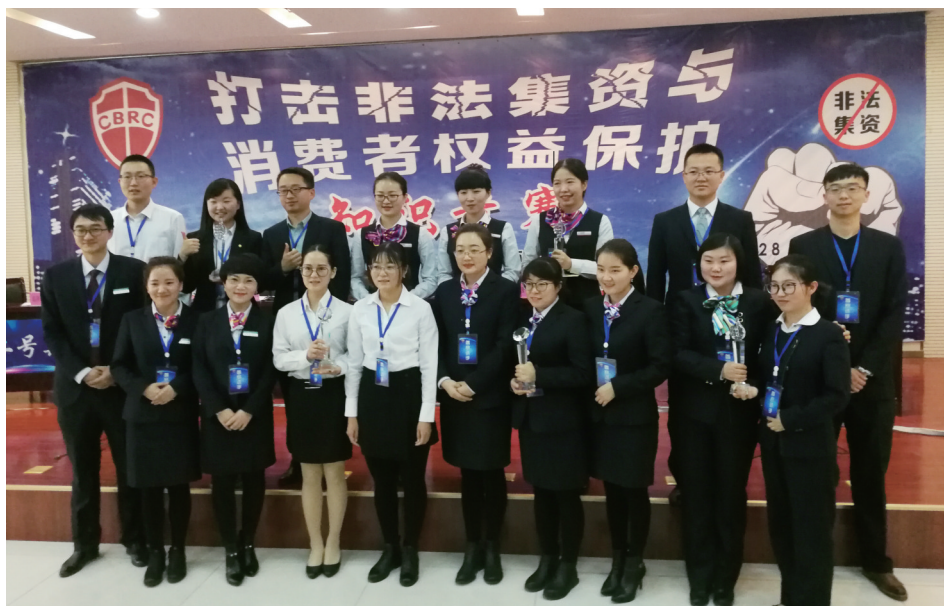
临泽农商银行在张掖市银行业金融机构“打击非法集资与消费者权益保护”知识竞赛中荣获二等奖