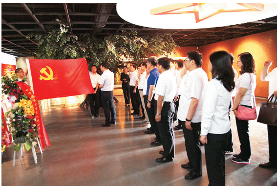
省联社机关党委开展庆祝建党97周年主题党日活动