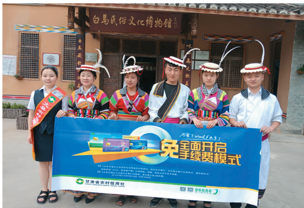
文县联社开展“厉害了WORD飞天卡全面开启免手续费模式”主题宣传活动