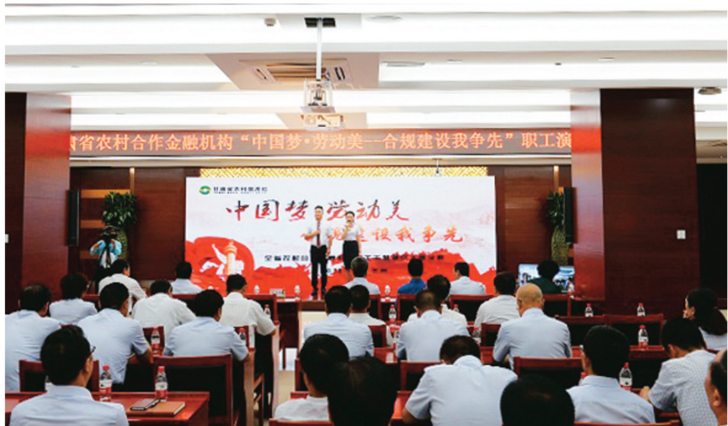
省联社举办“中国梦·劳动美—合规建设我争先”职工演讲大赛决赛