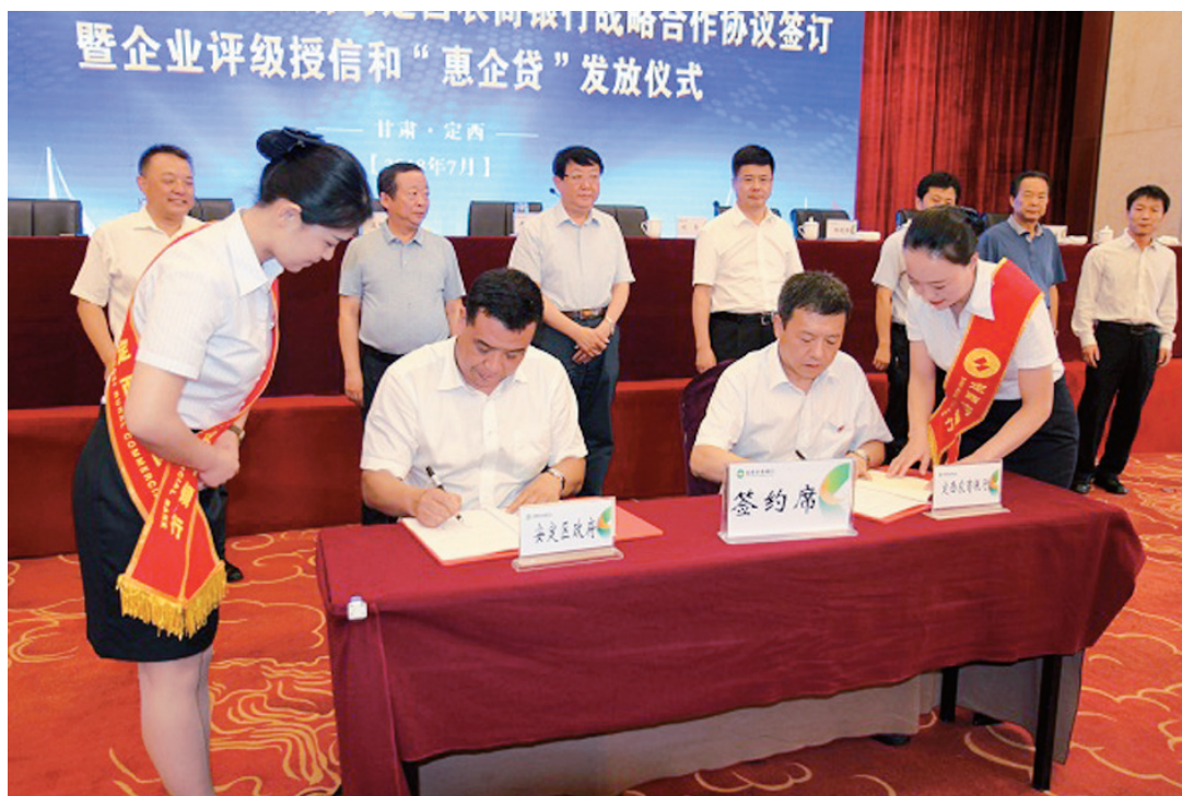
定西农商银行与定西市安定区人民政府举行战略合作协议签订暨企业评级授信和“惠企贷”发放仪式

今后，定西农商银行将不断提升金融服务，为实现全区脱贫攻坚目标任务、推动全区经济社会可持续发展做出新的更大的贡献！