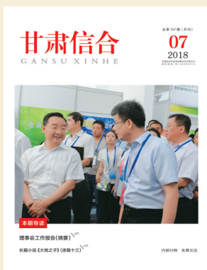
封面：省联社党委书记、理事长刘青陪同 省委副书记、省长唐仁健视察工作