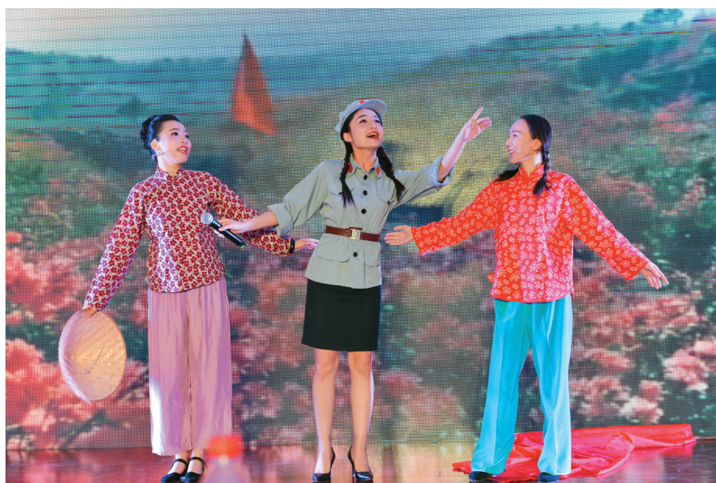
省联社机关党委举办“永远跟党走”庆祝中国共产党成立97周年文艺演出